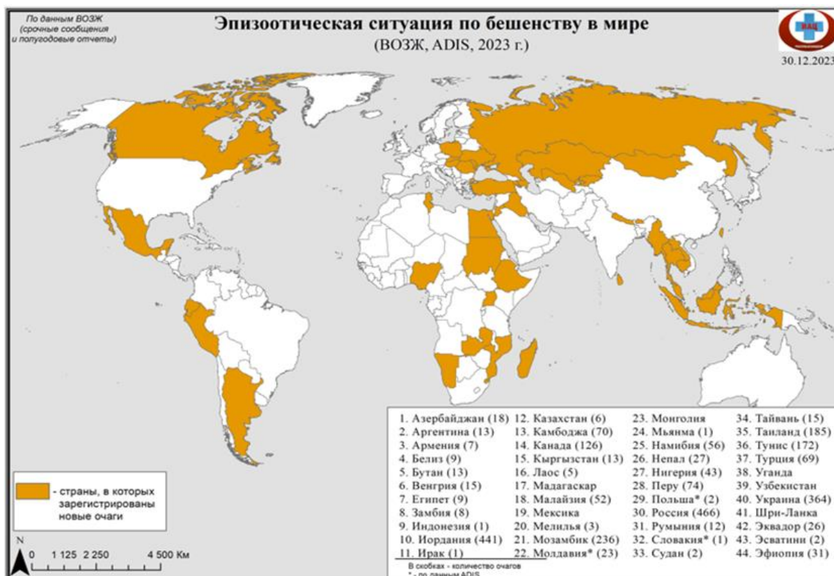
Рис. 1. Эпизоотическая ситуация по бешенству в мире

По данным Всемирной организации по охране здоровья животных (ВОЗЖ), бешенство является десятой по значимости причиной смерти людей в структуре инфекционных болезней и регистрируется более чем в 150 странах мира. Страны, подавшие сведения в ВОЗЖ о выявлении бешенства в 2023 году, представлены на рис. 1. Ежегодно в мире от этой болезни погибают более 55 тыс. человек.