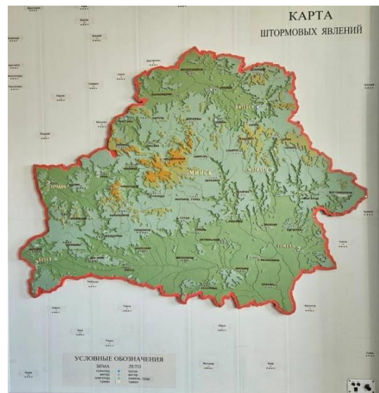
Интерактивная карта уже более 50 лет оповещает синоптиков об опасных явлениях

Как и раньше, все поступающие карты погоды и днем, и ночью дежурная смена синоптиков должна