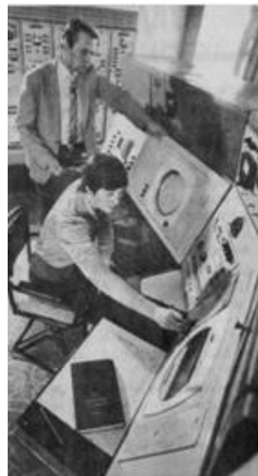
Метеорологический радиолокатор. 1979 год

А далее прогнозирование погоды развивалось семимильными шагами. Когда-то все началось с азбуки Морзе, а потом в гидрометслужбе начали использоваться данные искусственных спутников Земли, радиолокаторов, появились различные расчетные схемы и методы для прогнозов погоды различной заблаговременности, с внедрением компьютеров стало развиваться численное моделирование. Развитие прогнозирования шло в ногу с научным прогрессом, и прогнозы погоды становились все более точными, а заблаговременность их постоянно увеличивалась. Безусловно, залогом успеха в данном случае выступало то, что белорусская гидрометслужба работала с опорой на весь организационный, научный и технологический потенциал, имевшийся в распоряжении гидрометеорологов СССР.