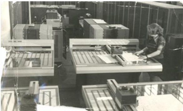
Наблюдение за работой автоматического графопостроителя

Однако были в этом и свои сложности для синоптиков: его рабочий день за счет необходимости обработки и построения многочисленных карт