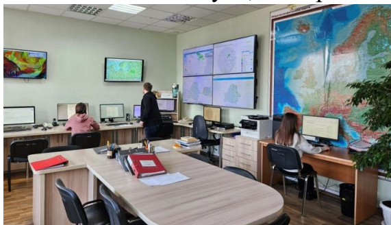
Отдел краткосрочных прогнозов погоды, неблагоприятных и опасных явлений

За последние несколько десятилетий, благодаря значительным достижениям в науке, внедрению новых технологий, появились улучшенные и более эффективные методы для проведения наблюдений и сбора данных от большого ряда источников, включающих радиолокаторы и спутники. Если раньше синоптику для того, чтобы понять, как